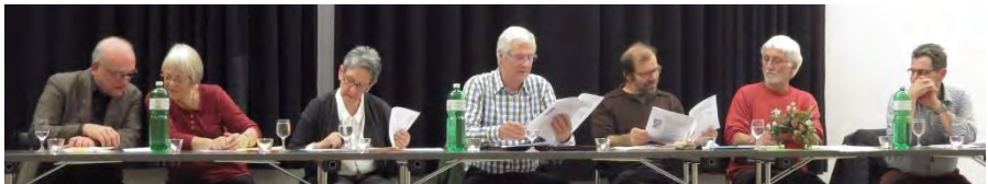
Vorstand an der GV 2015

In den Folgejahren schwankten die Mitgliederzahlen zwischen 23 und 35. In nahezu allen GV-Protokollen werden die Mitglieder gebeten, neue Sänger zu suchen. Werbeaktionen mit Briefen und Broschüren zeigten nur mässigen Erfolg. Allein persönliche Kontakte sorgten dafür, dass über die Jahre doch genügend Sängerinnen und Sänger die Empore in der Kirche füllten. Heute hat der Chor, inklusive Dirigent, insgesamt 31 aktive Mitglieder, 5 im Bass, 5 im Tenor, 9 im Alt und 11 im Sopran. Allerdings ist es schwierig, junge Stimmen für den Kirchenchor zu gewinnen; der Altersdurchschnitt lag im Jahr 2015 bei 65 Jahren, mit einer Spanne von 18 bis 89 Jahren.