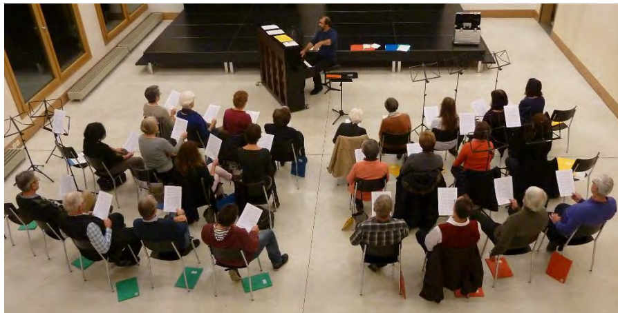
Chorprobe in der Arche

Die letzte Probe vor den Sommerferien wird traditionell statt mit Gesang mit einem zünftigen "Brötli" begangen.