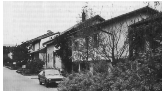
Überbauung Breitacher: Die vorgeschriebenen Gebäudefluchten, Firstrichtungen und max. Traufhöhen bringen Ruhe in das Quartierbild und begrenzen den Strassenraum von Anfang an klar. (Quelle 2)

Die Entwicklung der Detailvorschriften erfolgte auch hier bei der Stadtplanung Baden in enger Zusammenarbeit mit den Architekten der zum Teil bereits frühzeitig bekannten Bauherrschaften. Gemeinsam wurden die folgenden Kernpunkte der Überbauungsvorschriften fixiert: