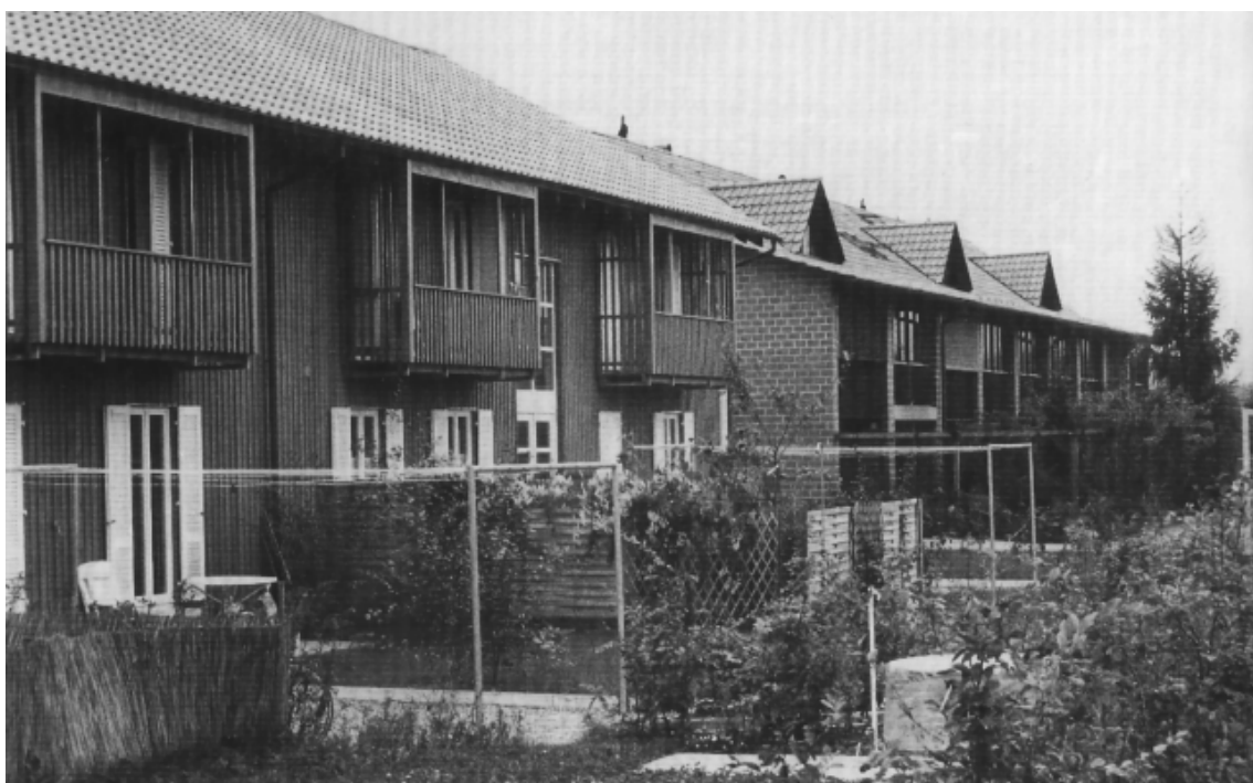
Gute Verträglichkeit zwischen den Überbauungen Haberacher I und II trotz verändertem Konzept und unterschiedlicher Materialwahl. Quelle 2)

Aus der Projektüberarbeitung resultierte - bei äusserlich ähnlichen Baukörpern - ein neues Überbauungskonzept, das eine additive Fortsetzung über das gesamte, noch verbleibende Haberacherareal zulässt. Im Gegensatz zur ersten Etappe waren jedoch nicht alle Baukörper vertikal als Reihenhäuser konzipiert. Im längsten Gebäude, entlang der Steinstrasse, sind, mit dem Ziel eine Bevölkerungsdurchmischung zu erreichen, 16 3-Zimmer-Geschosswohnungen eingeplant und erstellt worden. Die weiteren drei Baukörper enthalten gesamthaft 20 4-Zimmer-Reihenhäuser.