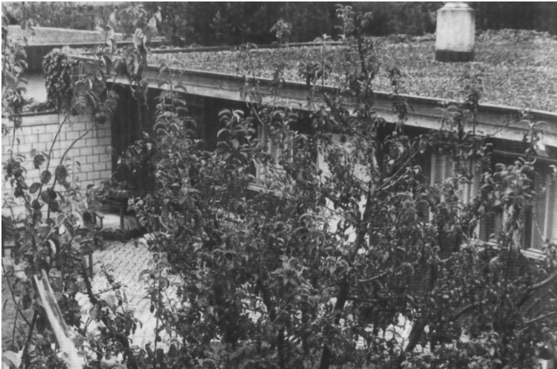
Überbauung Steinstrasse: Parzellentrennmauern auf der Hauptwohnseite lassen trotz Grenzbau individuelle Aussenräume entstehen.

Die Ölkrise von 1973 hatte auch in der Region Baden beträchtliche Auswirkungen auf das Baugewerbe. Einerseits war zwar der Markt an qualitativ gutem Wohnraum ausgetrocknet, andererseits war aber angesichts der allgemeinen Konjunkturlage wenig Risikobereitschaft und Bauwille vorhanden. Der Gemeinderat Baden fasste in dieser Situation den «antizyklischen» Entschluss, günstiges Bauland entlang der Steinstrasse in Rütihof bereitzustellen. Gleichzeitig wurde die Stadtplanung mit der Ausarbeitung von Spezialbauvorschriften beauftragt, um qualitativ gutes Bauen im Sinne eines hohen Wohnwertes sicherstellen zu können.