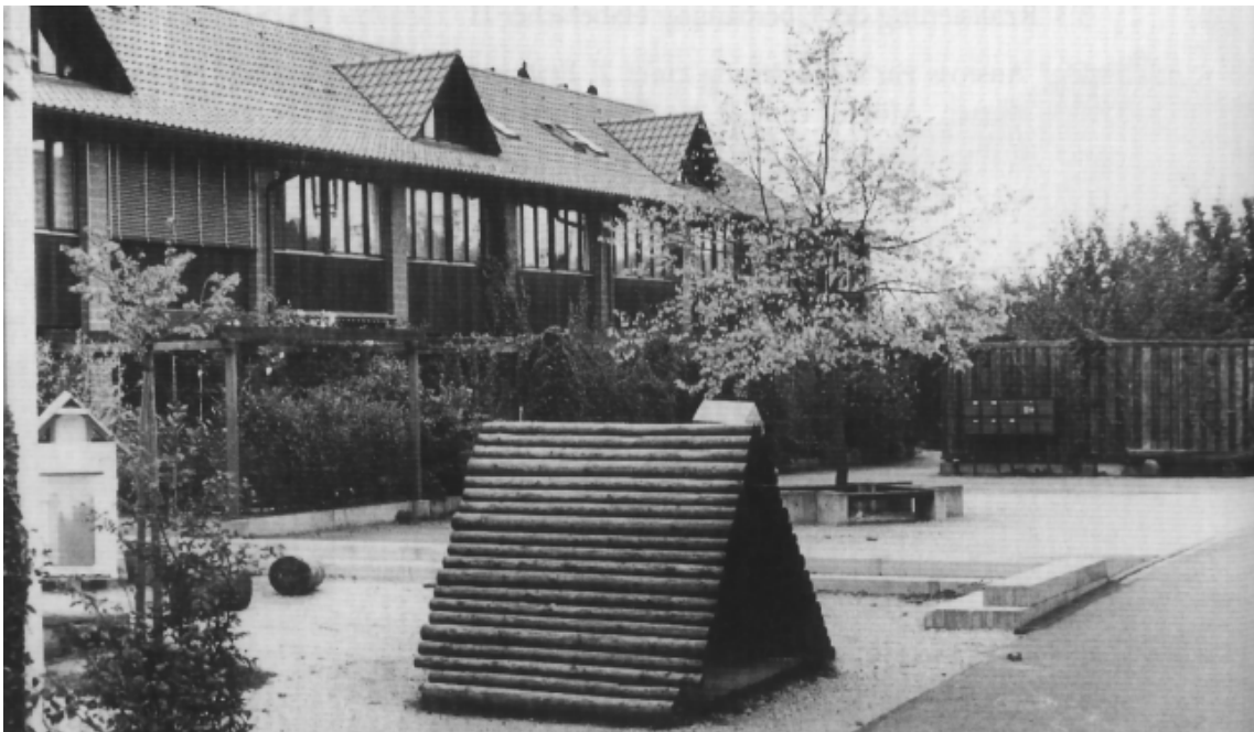
Überbauung Haberacher I: Ein klares Siedlungskonzept lässt wertvolle Aussenräume entstehen. Quelle 2)

Der zweistufig geplante Wettbewerb wurde unter den Badener Architekten ausgeschrieben. Zusätzlich wurden fünf auswärtige Büros, die durch die Realisierung von - im Sinne der Zielvorgaben - interessanten Wohnbauprojekten bereits Erfahrungen sammeln konnten, zur Teilnahme am Wettbewerb eingeladen, nicht zuletzt um damit die Zielsetzungen zu unterstreichen. Im Bericht des Preisgerichtes über die erste Wettbewerbsstufe wurde den eingereichten Arbeiten grösstenteils überdurchschnittliche Qualität attestiert. Zur Weiterbearbeitung wurden die vier erstrangierten Projekte vorgeschlagen. Das vorläufige Siegerprojekt von Prof. D. Schnebli sah eine zweigeschossige Überbauung mit Flachdächern und Attikaaufbauten vor. Die Überarbeitung (zweite Wettbewerbsstufe) brachte eine Umstellung der Klassierungen. Aufgrund starker Verbesserungen im Rahmen der Überarbeitung obsiegte schliesslich das Projekt der Architektengruppe Metron aus Brugg/Windisch.