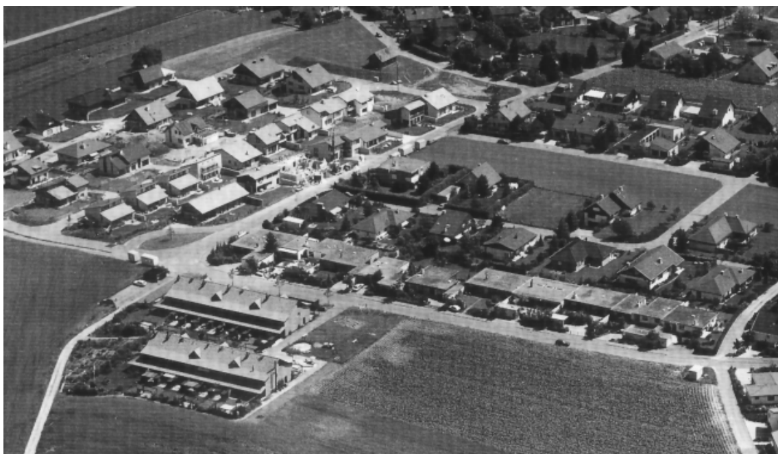
Siedlungsstruktur: Ein neuer Ortsteil von Rütihof entsteht. 1981 waren die Überbauungen Steinstrasse und Haberacher I fertiggestellt. Im Breitacher entstehen die letzten Häuser. Die Überbauungen Haberacher II, III und IV fehlen noch gänzlich.

«Die Veranstalter erwarten von diesem Wettbewerb einen Beitrag zur Bestimmung des baulichen Wohnwertes insbesondere in bezug auf die Anpassungsfähigkeit an verschiedene Benutzerbedürfnisse, die Veränderbarkeit der Raumbeziehungen usw. Dabei sollen die ökonomischen Bedingungen der Realisierbarkeit nicht ausser acht gelassen werden.» Im Kapitel «Wohnungspolitischer Rahmen» des Wettbewerbsprogrammes wurde zudem festgestellt: