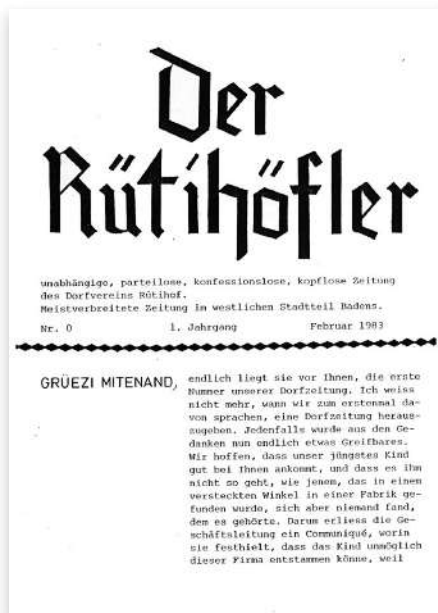
Titelblatt des ersten Rütihöflers